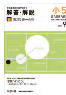
解答解説イメージ