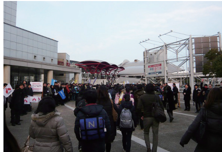
2015年入試では約2700名の 志願者が幕張メッセに集った1月20 日の市川（第1回）の入試風景

早くから親子でめざしてきた第1志望校については、 むしろ「迷わずに（事前の入試結果がどうであろうと も）」チャレンジしていくほうが、結果が良い場合が 多いということも意識しておきたい。