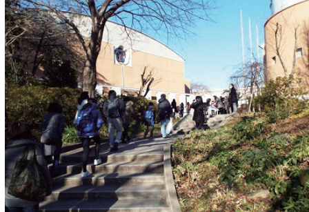
2015年入試では大人気を集めて話題を呼んだ三田国際学園中の2月1日午後の入試風景。

実際に出願する6校（6～8校）のなかには、必ずこの“押さえ校”を入れておきたい。どんなに力の