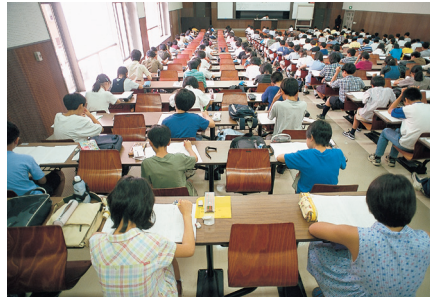
入試直前の時期にも、できるだけ「ふだんどおりの」生活をする事で、お子さんはストレスを発散できると考えておこう（写真は模試の風景）

保護者の仕事としては、綿密な受験スケジュール表を作成し、受験結果がわかったあとの（納入金や書類などの）段取りを再確認し、必要であれば、ご家族の間でしっかりと受験に関わる役割分担をしておきたい。できれば試験会