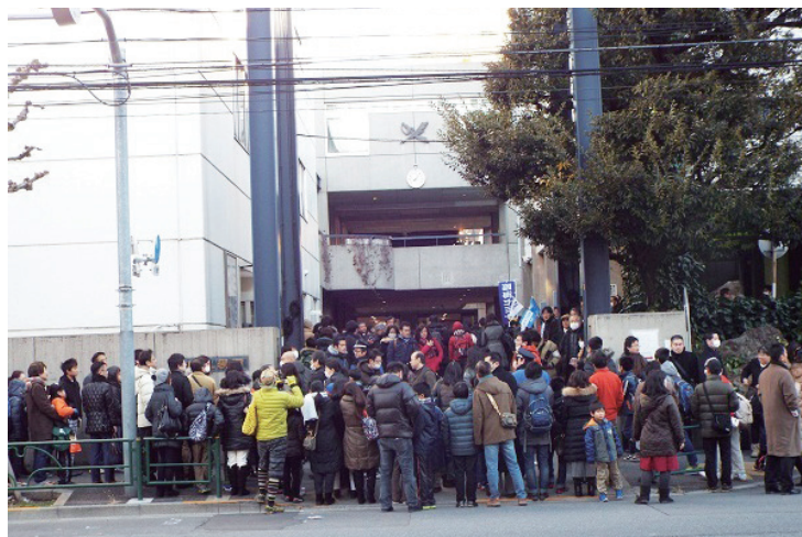
2015年2月1日に行われた開成中の入試風景。毎年大