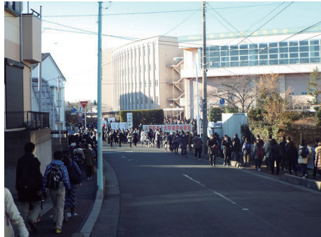
2015年入試では約6千人の志願者を集めて最大規模の入試となった1月10日の栄東中A日程の入試風景。

なかには、まだこの時期でも「歯が立たない」問題や、解法の糸口がすぐには見つけられない問題もあるかもしれない。しかし、それでも一向にかまわない。「できない」ことや「覚えていない」ことを恐れずに、まず