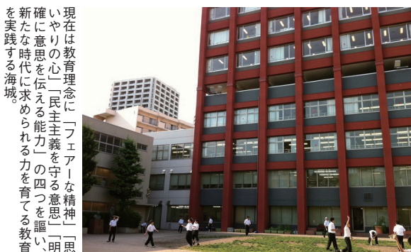
現在は教育理念に「フェアな精神」「思いやり」の心、「民主主義を守る意思」の四つを謳い、明確に意思を伝える能力」の四つを謳い、新たな時代に求められる力を育てる教育を実践する海城。

しかし、戦後の新たな民主主義教育と新学制が導入された際に、公立中学校はすべて共学となり、公立高校も（北関東から東北エリアの一