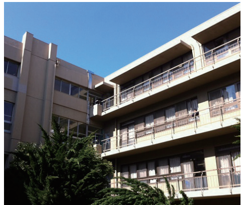
すでに創立時から、グローバル化をめざす「三理想」を掲げ、「自調自考」の姿勢を育ててきた武蔵。

たとえば、全国トップレベルの進学校として知られる兵庫県の灘中高の校訓は、初代校長であった嘉納治五郎（柔道の講道館の創始者。日本で初めてのJOC委員でもあったという）による「精力善用 自他共栄」という言葉。ちょっと変わった校訓であるが、これは現在も講道館に受け継がれている言葉でもある。後に灘中高の第5代校長を務めた故・勝山正麿先生は、この校