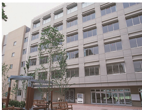
早稲田大学の付属(系属)校でありながら、「半進学校・半付属校」として多様な進路を実現している早稲田中学・高等学校。

実践女子学園、跡見学園など、かつて人気の高かった女子大学の付属中高は、いまでは軒並み「半進学校化」したといっていだろう。山脇学園は「半進学校化」どころか短期大学を廃止し、その教育リソース(施設)を中高一貫教育に集中させたほどだ。