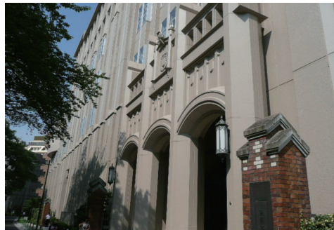
カトリック系の女子校に特有の家族的であたたかな雰囲気に包まれている雙葉。

そうした女子校には、躰や日本文化も大切にする学校が多かったため、また女子だけが学ぶ環境が大切にされ、独自の文化や「女子校らしさ」