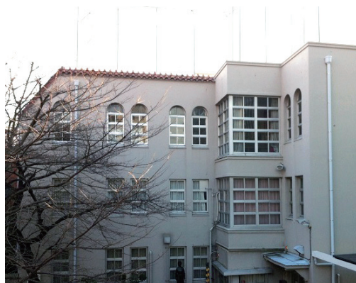
「勤勉・温雅・聡明であれ」、「責任を重んじ礼儀を厚くし良き社会人であれ」を校訓として、謙虚な心で日々の学びに向かう校風。

つまり、それだけ大らかで、先生や先輩に温かく見守ってもらえて、友人たちと和やかに過ごせる環境や風土が、多くの私立中高一貫校にはあるということだろう。