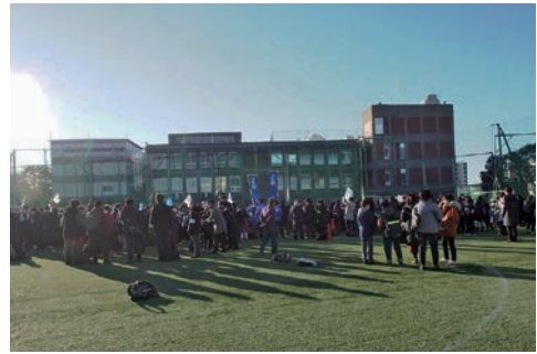
新校舎建築中のため、例年とは違った流れで実施された開成中の入試。

かつてアメリカの教育学者キャシー・デビットソン氏（当時ニューヨーク市立大学教授）は、「2011年度にアメリカの小学校に入学した子供たちの65%は、大学卒業時（2027年）に今は存在していない職業に就くだろうと予測し、マイ