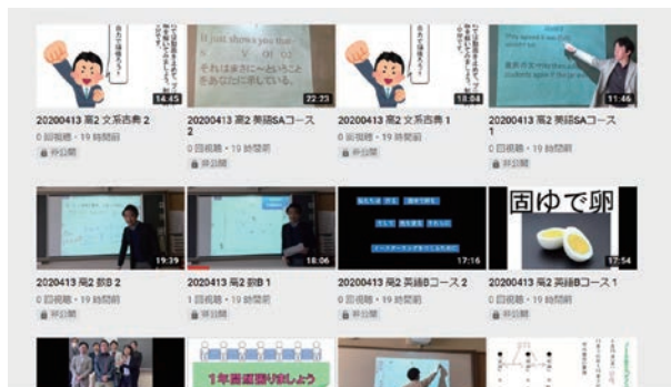
聖学院中高では、4月13日（月）から全教員が作成した100本の動画授業の配信をスタートさせた！

しかし、そうした状況下でも、多くの私立中学校・高等学校は、独自の工夫と安全対策を考え、休校の間の授業や行事、生徒の学習、健康と安全管理のための方策を実現し、「いま学校に何がで