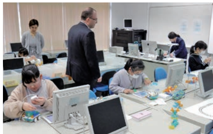
聖和学院中が今春2020年から新設した「英語プログラミング入試」。大きな反響があったという。

その私立中の多様化した入試の形態は、「適性検査型（公立一貫対応型）入試」をはじめ、「合科目・総合型入試」、「記述・論述型入試」、「PISA型入試」、「思考力入試」、「自己アピール（プレゼンテーション型）入試」や「英語（選択）型入試」など、バリエーションは多岐にわたる。それ以外