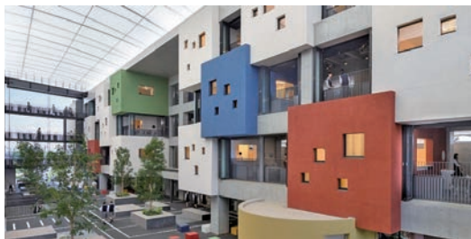
来春2021年から開校する川口市立川口高等学校附属中学校。かなり大きくの志願者を集める。

同高校は、市立高等学校3校（川口総合高等学校、川口高等学校、県陽高等学校）を1校に再編・統合し、2018（平成30）年4月に川口市立高等学校として設置された新設校。素晴らしいキャンパスと新校舎が魅力。附属中学校も高い人気を集めることが予想されている。