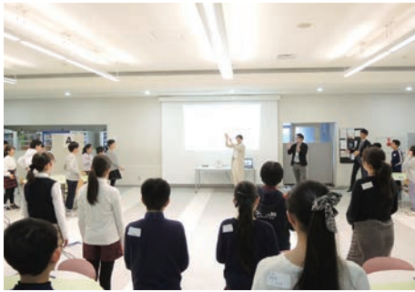
「思考力入試」実施校の先駆けでもある、かえって有明中のアクティブラーニング型「思考力特待入試」の風景。

せっかく私立中学校の側が、そうした新たな受験機会を設けてくれたのであれば、受験生（小学生）と保護者は、自身（わが子）の得意な教科や強みを生かして、それに合った入試を実施している私立中に、自信を持って挑戦していけばよい。