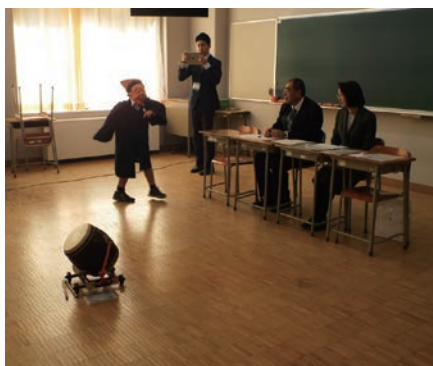
従来の「2科・4科入試」を実施しないように、自己実践型の入試を注目のポイントとして注目を集めている。表現入試(プレゼンテーション型)の新しい形態で注目されている。自己実践型の入試を注目のポイントとして注目を集めている。

けられるチャンスをできる限り生かして、数多くの学校(入試機会)にチャレンジすることだ。