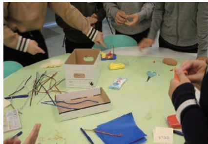
2月3日午後、実施された、思考力特待入試（2020年）の様子。

合型」「記述・論述型」「思考力型」入試などの「新タイプ入試」が数多く存在する。そうした入試形式が得意な受験生には、かえって後半戦にチャンスが増えていることになる。