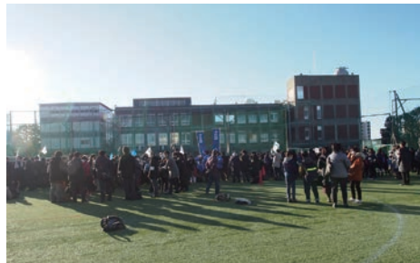
来春2021年入試では、合格発表をWEB掲載に変更する開成中の2020年入試風景。

来春2021年の首都圏中学入試では、お子さんたちが7年後に挑む「(2024年度以降の第2期)大学入試改革」につながる私学の授業改革・入試改革の動きに対する人気動向の変化をはじめ、全体としては人気が錯綜し、そのなかで厳しさを増す学校が出てくるはずだ。そして、それは難関校だけではなく、中堅～中堅下位の私学のなかにも出てくるだろう。