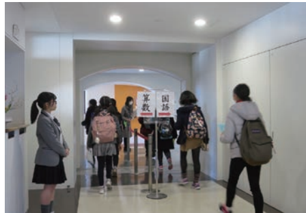
2019年入試から2月1日午後1時に「国算どちらか1科」の選択入試を導入している山脇学園の入試風景

午前～午後と、まさに「ダブル受験」をするわけだから、それだけの体力と精神力が必要とされるだけで