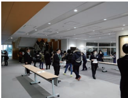
来春2021年入試からの女子募集に加え、「聞いて解く出題」や「言語技術」の選択など新たな入試改革を打ち出した芝浦工業大学附属中の入試風景。

こういった、受験生にとって「チャレンジしがいのある」問題が増えてきた最近の入試状況を踏まえて、各自の志望校の出題の特色をつかむことができれば、