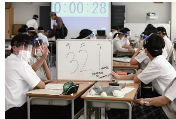
フェイスシールドをつけながらだったが、2組では4人1組に分かれ、普段通りに合議。3-2が1番＝サニーという奮った標語が選ばれた