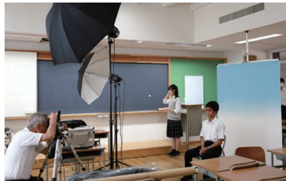
中1生は生徒手帳に貼る写真撮影に臨む。瞬時マスクを外し、緊張の面持ちに