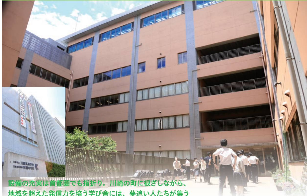
設備の充実が首都圏でも指折り。川崎の町に根ざしながら、地域を超えた発信力を培う学び舎には、夢追い人たちが集う