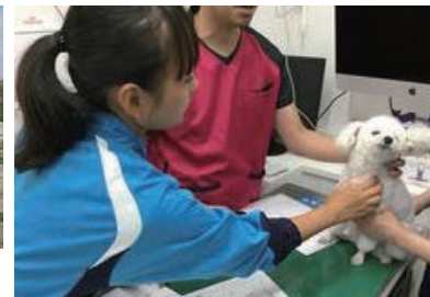
中2の職場体験先も豊富。動物病院だけでなく、牧場でも家畜と触れ合えるのが川崎だ

文化祭は中高合同で行い、生活科学科のファッションショーを普通科生徒も楽しみにしている