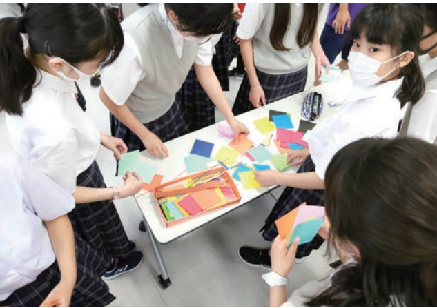
全学年が色紙を貼り合わせ、自分の名札代わりの「バッチワーク」を作る