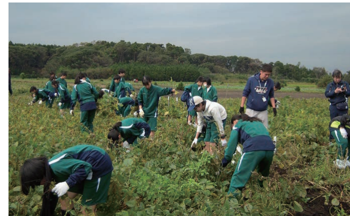
7月に播いた枝豆の種が10月にはこんなに大きく育つ。千葉県君津市で借り上げた農園にて

また7月下旬には、学校を3日間開放しての、「English Camp」も待ち受ける。これは川崎市が契約するALT派遣会社のスタッフが20数名も大挙して押し寄せ、日常が英語で染められてしまうという、画期的な企画。むろん日本語の使用は禁止で、英語科以外の教諭も必死になって英語で食らいつく。そんな様子を眺め、最初はおずおずとしていた生徒も、3日目には外国人スタッフに