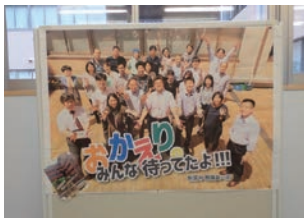
控えめに貼り出された教員手製のポスターに、市立川崎のチームワークが光る