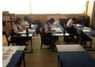
エントランスにも大胆な筆遣いの書が飾られ、書道部の活動の熱心が伝わる

ファッションショーは檜舞台。また、食物系の模擬店もひと味違う。市立川崎が長らく地域住民に愛されてきたのも、こうした場での彼らの貢献が大なのだ。今回の訪問では部活も一切見られな