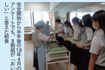
完全開始から半年後の18年4月のアンケートでも、8割超が「おいしい」と答えた給食

美術や外国語指導助手の参加する英語など、オンラインではどうしても及ばない授業に、今の学校の魅力は詰まっている。それらも問題なく始動した様子。やっと取り戻した日常を元の本阿弥にせぬよう、「新しい生活様式」への留意は必要だが、もろもろの遅れの挽回もスムーズに行きそうだ。