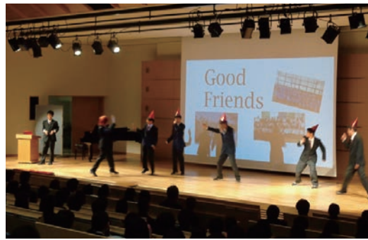
生徒全員が英語で様々なパフォーマンスをする、12月の「English Challenge」も例年大盛り上がりだ

ファッションショーは檜舞台。また、食物系の模擬店もひと味違う。市立川崎が長らく地域住民に愛されてきたのも、こうした場での彼らの貢献が大なのだ。今回の訪問では部活も一切見られな