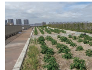
フィールドワークに先立ち、校舎屋上の菜園にも同種の種を植え付ける。当番の生徒が夏休みに水遣り、手入れを行う