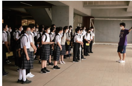
1時間を要してクラスの分担を決めた後、1年生は初めて校内を見て回った

ん。専門学科や定時制、南部地域療育センターを含めた教育・福祉機関が同じ場に集まっています」