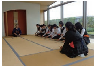
表千家の講師に季節に応じた礼作法を学び、お点前を練習する茶道部

夏休みが終わると、すぐに文化祭。9月に行われるが、旧暦10月にちなみ「神無祭」と呼ぶ。普通科だけでなく市立川崎の底力を体感する空間だ。生活科学科服飾系にとって、オープニングの