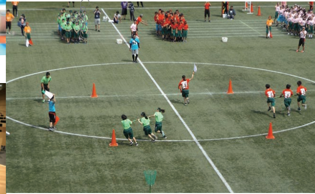
体育祭は競技だけでなく、応援合戦、Tシャツ、応援団幕の部ごとに6ブロックに分かれて競う