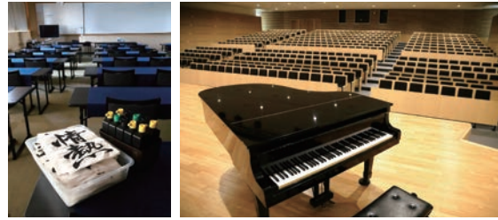
約500人を収容する講堂も自慢。書道室には背の低い専用机が置かれていた