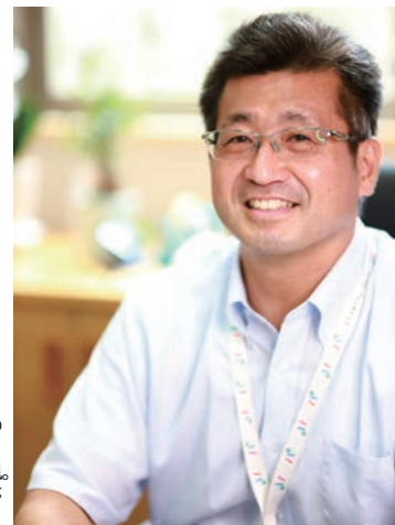
教育目標「LEAD」の中でもとりわけ、D = Dream を重んじる校風。それは植村校長自身が夢多き教師だからだ