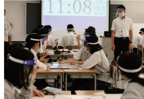
中3の3クラスは年間の学級目標を定めるため、生徒が意見を戦わせていた