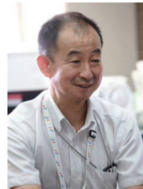
昨年からは兼任した今教頭。大卒後しばらく日産自動車に勤務し、工場の労務人事を担当というキャリアが活かされている

じく代表曲、『見上げてごらん夜の星を』は映画にもなりましたが、元は定時制を舞台にしたミュージカルの主題歌なんです。