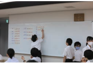
ほぼ全員にクラスでの役割がある。1年生でも積極的に自薦する