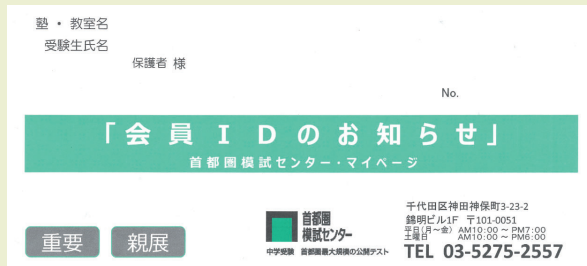
『会員IDのお知らせ』イメージ (圧着封筒)

●受験票と一緒に塾より配布される「会員IDのお知らせ」に記載されています。(初回のみ)