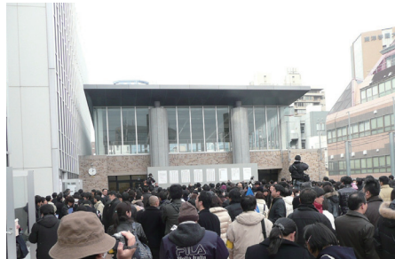
難関校になるほど合格発表の時刻が近づくと現場は緊迫感に包まれ、合格者の受験番号が掲示された瞬間には喜びの声があがる（写真は桜蔭）。

女子学院は2006年に合格発表を2月2日の10時から11時へと変更。同様に雙葉も、合格発表時刻を2日の8時から9時に変更している。これも記述問題の増加や途中式・考え方を書かせたものを、丁寧に採点するための措置と考えられる。また雙葉は2007年から体育実技を廃止した。共学校では、青山学院が2006年に2科・4科選択入試から