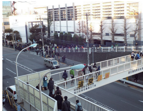
男子受験生にとっての首都圏私立の最難関、開成の2月1日の入試風景

これまで2年ないし3年の受験準備の期間に、高い目標に挑む気持ちを維持したままで、それぞれ