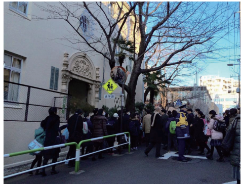
女子受験生にとっての首都圏私学の最難関、桜蔭の2月1日の入試風景。

そういう実感と、出題をひと通り見渡したときに「この問題から解いていこう」という手順を判断できる“見極めの力”が身につけば、なおさら自信をもってよい。こうした手応えに近いものを、入試直前までに何度か実感できることができたならば、合格にあと少しで手の届くところに来たと考えてよい。