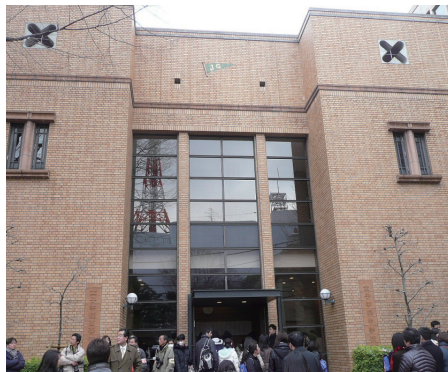
入試が連日続いている間にも合格発表が行われる。写真は例年2月2日午前中に行われる女子学院の合格発表風景。

学力的にはいくつも穴や弱点が残っている受験生であっても、悲観することはない。残り2か月のラストスパートで、学力的な強み（長所）に思い切り磨きをかけ、そこで鍛えた力を武器に、自信を持って難関校に挑んでいってよいのである。