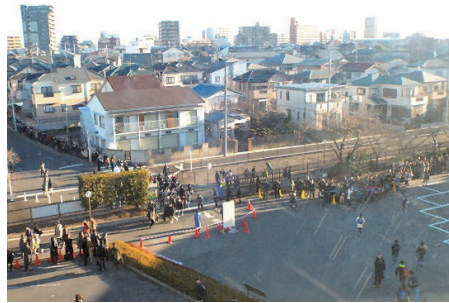
首都圏中学入試の最初のヤマ場 日米東A日程の入試には約5000名 の受験生が集結する！ 1月5日

そうした個性的な入試問題に立ち向かい、合格を得るためには、「偏差値からは見えてこない」ポテンシャルや、「偏差値を乗り越える」だけの気力と学力(=合格力)が求められる。