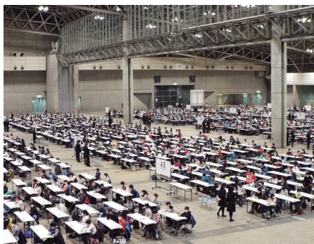
1月の千葉エリア入試の風物詩となっている市川中の1月20日幕張メッセ入試には毎年大勢の受験生が集結する！

活へ踏み出してほしいのだ。自分の力で合格して進学した学校をお子さん自身が「自分にとっての最良の学校」と受け止め、勉強にもクラブにも打ち込み、楽しく豊かな6年間を送ることができれば、それが本人にとっての、将来に向けた大きな自信を育ててくれる。