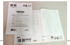
*問題の外側が解答用紙

自宅受験の為、座席番号シールは同封していません。解答用紙の氏名欄に氏名を記入してください。表紙の 「注意事項」 を読んでから試験を始めてください。