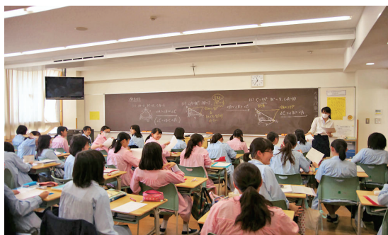
登校すると校内では制服の上に着用するスモックをはおる。ピンクと水色は自由に選べる。

この「共同担任制」は、中等科では4クラスを6名の先生が、高等科では3クラスを6名の先生が「共同担任」として受け持ち、生徒の学校生活と日々の成長を見守っています。