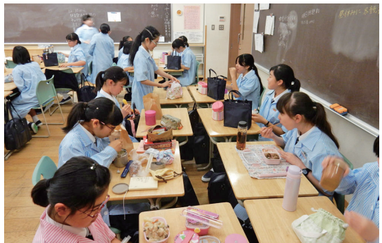
お昼休みはみんなで昼食。校内には生徒に大人気のパンの購買もある。

「わざわざディスカッションとかグループワークを設定しなくても、そういう生徒がポンポンと発言するの