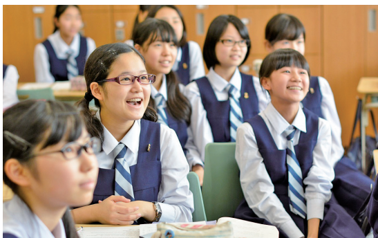
各科の教員は専門性が高く授業の水準は高いが、そうした学習に生徒は日々真面目に取り組む。

光塩の6年間の学びを通して生徒一人一人を夢の実現に導くことができるという確信のもと、2010年に第1回の『総合』型入試を実施しました。ちょうどその頃に、近隣エリアで2月3日に入試を実施する公立中高一貫校がいくつも開校しました。その競合から逃げるのではなく、光塩独自の姿勢を示すことで『打って出る』という思いもありました。中等科入試の時点では、例えば理・社の知識が十分でなくても、“その場で考える力があり伸びしろがある”子どもたちに光塩を知ってほしいと強く思ったのです。光塩の学びによって総合力を培い、大学入試のハードルを越えて夢が叶