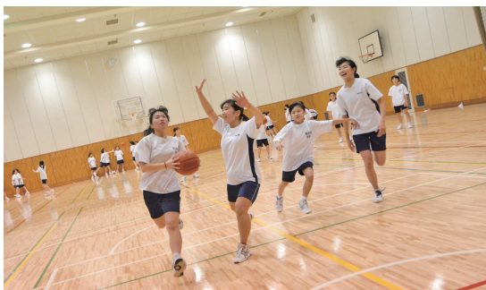
地上の校庭・中庭に加え、地下には体育館が3つもあり、生徒が身体を動かす運動スペースも十分ある。

「すでに中等科の校舎は8年前に建て替えました。中央に吹き抜けがあって、教室を出ると、広い廊下のスペースで子どもたちも休み時間を自由に過ごせるようになっています。また吹き抜けがあることで、他のフロアの学年の声や動きも少し伝わってきます。いまは外に子どもが遊べる原っぱなども少ないですから、多くの子どもたちが集まり、声が聞こえる空間にしたかったです。光塩は共同担任制で、学年でまとまって子どもたちを育てていこうという考え方がありますので、互いの存在を感じられるような環境も大事だと