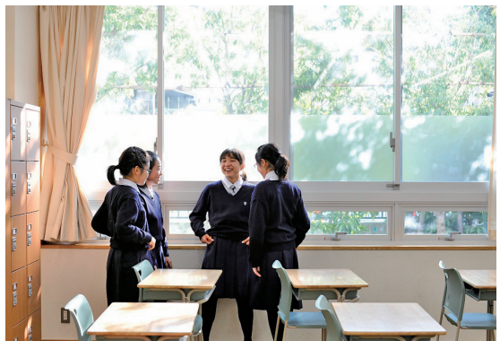
吹き抜けのある校舎の教室や廊下には明るい陽光が差し込み、天気の良い日は照明も不要だ。

そうした「総合」型入試に関する先生方からのメッセージは、多くの小学生と保護者にとっての“希望”でもあります。同時に、従来からの4科目型の受験生も含めて、光塩女子学院をめざす受験生が一人でも増えることを期待したいと思います。