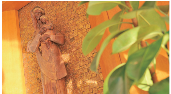
校内の各所にマリア像が飾られ、生徒の学校生活を優しく見守っている。