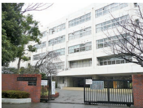
100年以上の歴史を持つ伝統校だ。創立から中