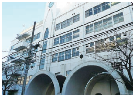
都内では最初の公立中高一貫校となった白鷺高校附属中学校。中高一貫の実績をあげた。生の卒業初年度から立派な大学合格