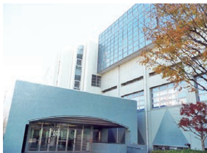
公立中高一貫校のなかでも、中高6年間の継続性・一貫性を生かして目立った成果をあげている都立小石川中等教育学校。