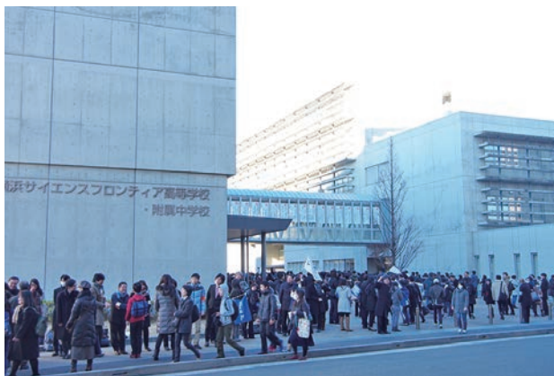
2017年に中学を開校した横浜市立横浜サイエンスフロンティア。初年度から人気を集め、高いレベルとなった！

ただし、中高一貫教育は、見方を変えれば、必ずしもメリットばかりとは限らない。高校受験というハードルがないことで生まれる「中だるみ」をデメリットと考える見方もあるだろう。しかし、ほとんどの私立中高一貫校では、先の「中だるみ」の時期さえも、生徒が自分の内面を深く見つめ、その先の人生や将来の目標をじっくりと考えることで、精神的に成長できる貴重な時間と位置づけ、それをプラスに転化するような導き方やキャリア教育の仕掛けなど、多様なノウハウを形作ってきた。