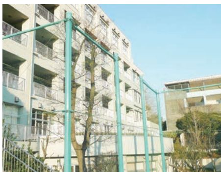
両国、小石川と同じく2006年に設置した都立桜修館中等教育学校。近隣エリアでは毎年高い人気を集めている。

すべての公立中高一貫校の志望者と保護者が、そこで「わが子にあった」学びの環境を得て、実り多い受検（受験）体験をしていただくことを、来春2019年入試に向けて心からお祈りしたい。