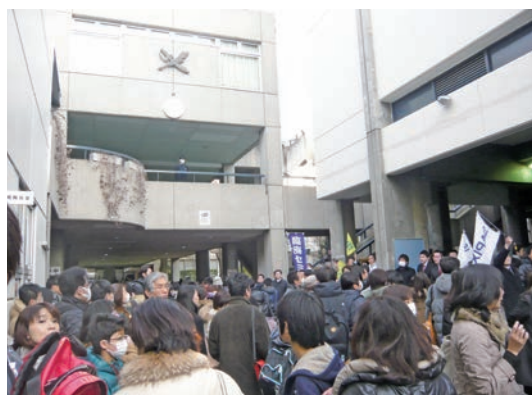
開成のシンボルでもある「ペン剣」は男子中学受験生にとっては憧れの存在（左は同校の入試風景）