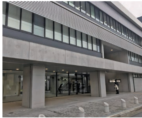
2019年から中学校を新設する細田学園の「原体験」を機軸に据えた独自の人間教育が開校前から高い注目を集めています。

一方、生活面の指導でも、すでに中1の段階で精神的にも成熟しつつある女子へのアプローチと、まだ小学生の雰囲気抜けきらない男子に対するアプローチとでは、当然ながら違った形のほうが効果的です。とくに「キャリア教育」の場面などでは、この年齢の男子と女子とでは反応や吸収の違いが顕著に表れます。それゆえ、ほとんどの女子校では、中2くらいの早い段階から将来のキャリア（進路や職業選択）を考えさせるプログラムを設けていますが、男子校の