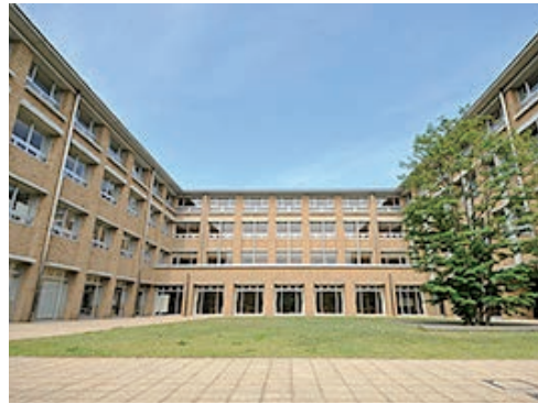
カトリックの教えに基づいた「ライフガイダンス」で一人ひとりの価値観を育む晃華学園。

すでに全国の公立中学校や公立高校の大半が共学となっている現代では、男子校・女子校はすでに“少数派”であり、そのことが私学の最もたる特徴となっています。