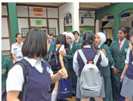
SGHとして、さまざまな国際交流を展開する富士見丘