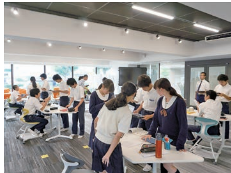
2017年に完成した聖徳学園の「ラーニング・ commons」では、ICTを活用したSTEAM教育が実践されています。

共学校では、そのように精神的な発達リズムの異なる男子と女子が同じ環境の中にいることになりま