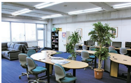
放課後にはネイティブ教員が常駐する東京成徳大学中学の「グローバルラウンジ」。

英単語、英熟語を覚えたかを競う『英単チャレンジ』にも取り組んでいます。この『英検まつり』は英語科教員だけではなく、全教科の教職員が関わる一大イベント。体育祭と同じようにクラス対抗で行われるので、互いがよい刺激を受け合いながら、飛躍的に上級の合格者数を伸ばしています。