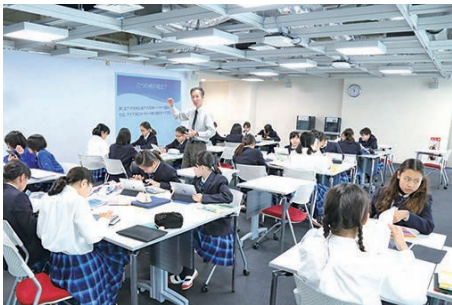
最新のICT機器が整う和洋九段女子の「フューチャールーム」では、能動的な授業が展開されています。

それは将来の職業選択と、結婚・出産など女性にとっての人生の節目や、その後の職業復帰なども含