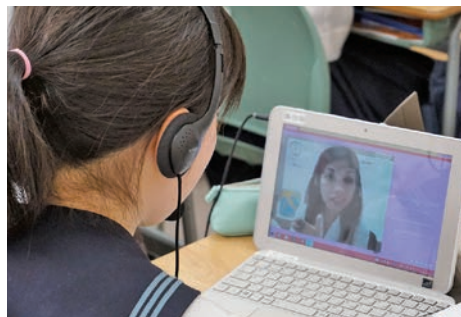
インターネットの通信機能を活用して、海外のネイティブ講師と気軽に会話を楽しめるオンライン英会話。

併設高校がSGH（スーパーグローバルハイスクール）に指定されている●佼成学園女子では、ネイティブによるイマージョン教育をはじめ、毎年6月と10月には『英検まつり』を全学年で実施。期間中には、放課後の級別『英検対策講座』の開講や、どれだけ