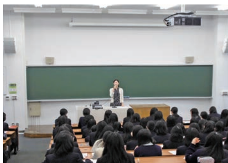
東京家政大学附属の「ヴァンサンカン・プラン」ではOGによる講演も行われている。

めた「キャリアデザイン」を考えさせるものであり、もっと長い目で自分自身の価値観(人生観)や生き方、ライフワーク・バランスを考える「ライフデザイン」教育へと進化してきました。