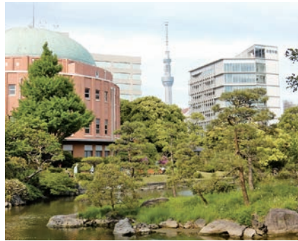
共学化から5年目を迎える安田学園の新校舎(右上)。先進特待コースに加え、一般入試の人数も再び上昇してきた。午後入試もうまく選んで活用したい。

午前～午後と、まさに「ダブル受験」をするわけだから、それだけの体力と精神力が必要とされるだけでなく、場合によって（最悪の場合）は、当日のうち