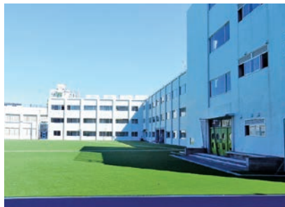
2016年から「Web出願」システムの導入し、2月5日の3次入試の出願を、前日4日の24時まで受け付けて注目された返字開成。受験生の保護者には好評だった。

また、来春2018年入試では、この後半戦に「総合型」「記述・論述型」「思考力型」入試などがいくつか新設されていることにも注目したい。そうした