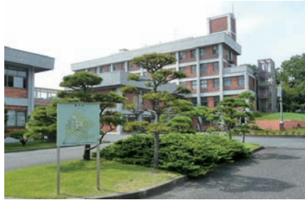
今春2017年入試から2月1日午後後に「2科または英語」を集めている清泉女学院。

ことではない。しかし、これまでの受験勉強に加えて、志望校の「過去問題」に何度も粘り強く取り組んでいくうちに、確実にこうした力が養われていく。本人にも“勤が働く”ように感じられるときが必ずやってくる。