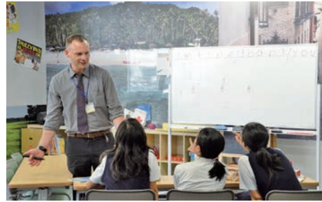
関東学院六浦では最先端のグローバル教育と英語教育のプログラムが展開されている。

には、すでに大学入試の制度が変わっている。緊急課題とされる教育のグローバル化に向けて、いま日本の教育は大きな転機を迎えている。