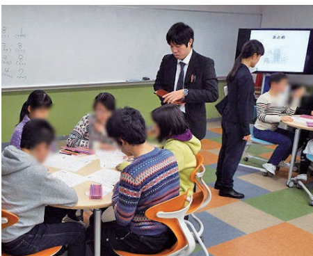
宝仙理数インターでは、今春2018年からアクティブラーニング型の新入試一理数を導入した。

第1の「なるべく数多く受ける」こととは「受けられるチャンスをできる限り生かして、数多くの学校(入試機会)にチャレンジすること」だ。