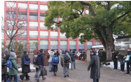
中学入試の合格最低点は、たとえ難関校であっても意外に低い！（写真は海城中の入試風景）

ことではない。しかし、これまでの受験勉強に加えて、志望校の「過去問題」に何度も粘り強く取り組んでいくうちに、確実にこうした力が養われていく。本人にも“勤が働く”ように感じられるときが必ずやってくる。