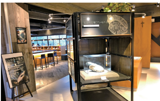
2018年5月に完成したSCL(Seiko Culture Lab)と呼ばれる図書室。初めて訪れたときには驚かされたほどの素晴らしい室内デザインと居心地の良さ。卒業生でコーヒーハンター川島良彰氏プロデュースの1杯100円の美味しいコーヒーを飲みながら「自ら学ぶ」ことができる!