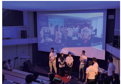
2019年8月～9月にかけて静岡聖光学院のキャンパスと寮を拠点として実現した第1回『国際未来共創サミット』の様子。アジア7か国から集まった高校生が、みごとに集合知を形成して“未来への希望”を感じさせてくれた！