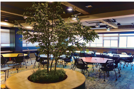
今年 2020 年 2 月に完成したデジタル工房『BIGIRION GARAGE』。「美術・技術・理科・音楽」の頭文字を冠した多種多様な活動や創造の拠点という意味で、すでに在校生は自由に利用して活気ある空間になっているという！