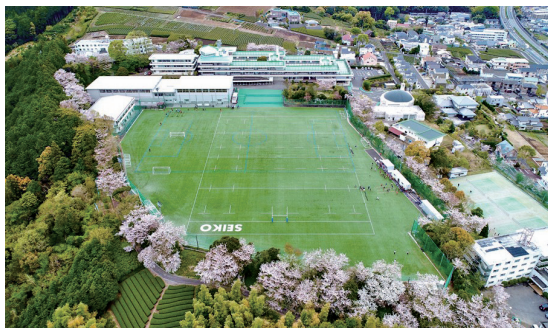
生徒がドローンで撮影したという静岡聖光学院のキャンパス全景。この写真上方には駿河湾。下方には富士山が見える風光明媚な立地にある。

現在の学院長の岡村壽夫先生は、この静岡聖光学院の卒業生でもあり、初代校長ピエール・ロバート先生の教え子でもあります。その岡村先生が校長在任時代