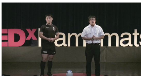
初代校長の名を冠した『Pierre Robert Hall』で鍛えたプレゼンテーションスキルで「TED 浜松」に出場し、大人に負けないプレゼンを見せてくれた静岡聖光学院生!

「そしてこの図書室SCLには、司書資格を持つ教員とは別に、理科が専門の教員が『店長』に任命されていて、この店長が勝手に(=自由に)店内のデコレーショ