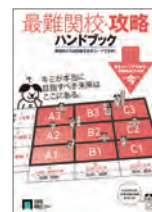
◀ 攻略本イメージ ▶