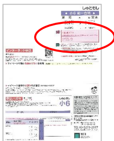
●個人申込の方用見本 (6年生・申込用紙)

昨年度にマイページを開設済みの方は、年度切り替え時に新しい受験番号に更新しておりますので、手続きは特にありません。そのままお使いいただけます。